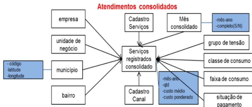
Figura 1 – Atendimentos consolidados

Desta forma, a exploração de serviços e atendimentos em canais específicos pela distribuidora pode ser estimulada, ampliada ou reduzida, com possíveis melhorias de seus custos operacionais. Para isto, uma visão detalhada do uso dos canais de relacionamento e serviços pelos clientes nas diversas regiões, cidades, bairros deve ser caracterizada (um exemplo da organização dos dados é apresentado na Figura 1). A realização, gestão e acompanhamento de campanhas especiais com base na realidade local pode ser mais assertiva do ponto de vista da fidelização e atendimento às expectativas dos clientes.